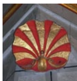
6 Coquille St-Jacques