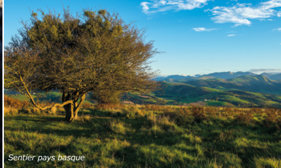
Sentier pays basque