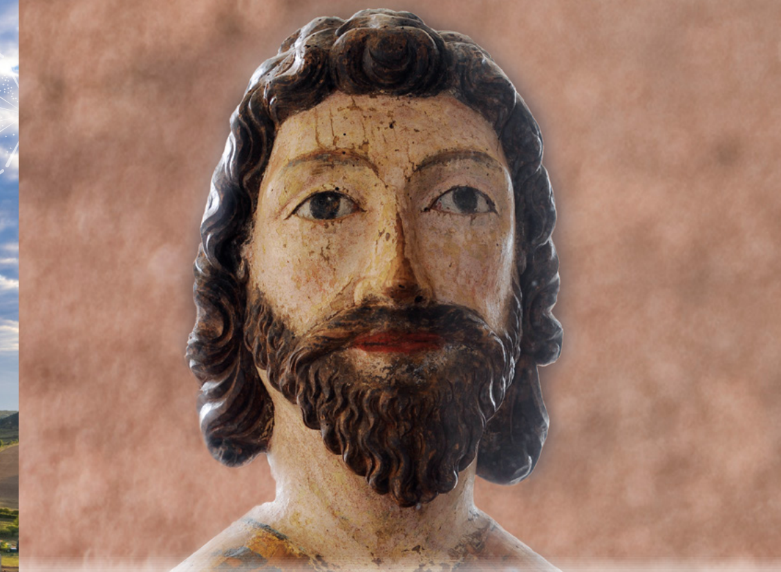
Buste reliquaire saint Jacques, Asquins