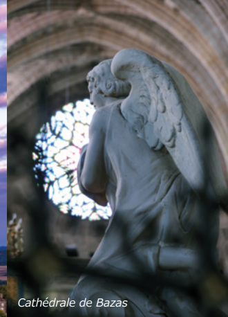
Cathédrale de Bazas