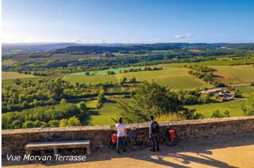
Vue Morvan Terrasse