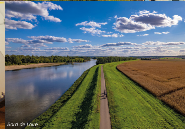
Bord de Loire