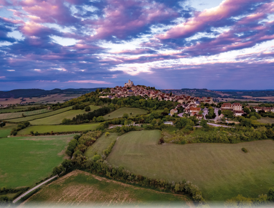
Colline de Vézelay